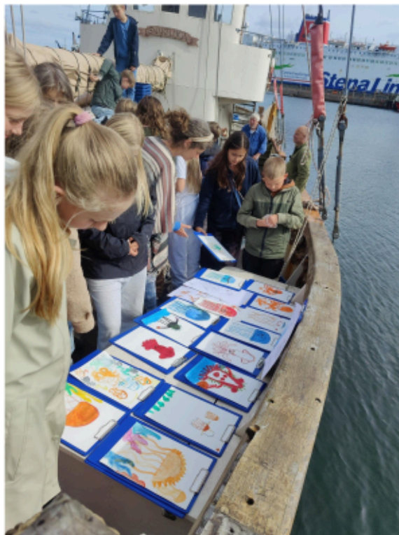
"Vandvenner" Norddjurs friskole i kunstforløb